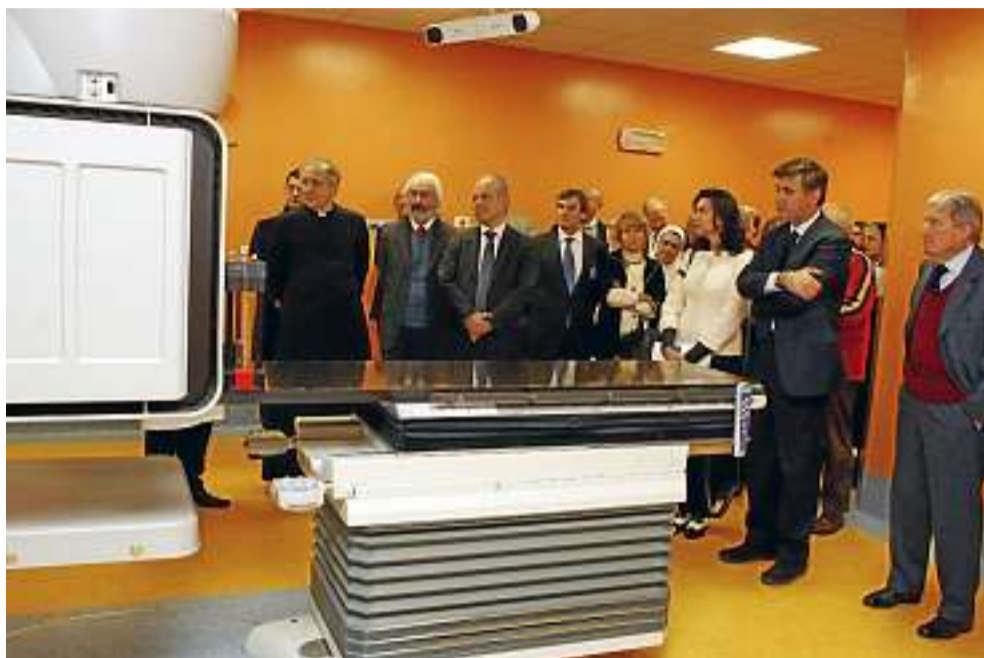
Le autorità cittadine in visita al Centro di radioterapia «Guido Berlucci»

NELL'OCCASIONE il vescovo di Brescia monsignor Luciano Monari ha sottolineato la missione della Poliambulanza in ambito sanitario, perché «per curare i malati ci vuole il desiderio di mettersi a disposizione dell'altro, di «stimare» la sua vita». Il sindaco Adriano Paroli si è invece soffermato sulla «presenza delle Ancelle che hanno dato tanto alla città, un'attività ancora più preziosa perché applicata alla cura delle persone», suggerendo anche una nuova accezione terminologica del concetto di «pubblico», che trascende l'appartenenza statale: «E' pubblico ciò che è per tutti - spiega il primo cittadino - ed è proprio questo che contraddistingue il vostro impegno».